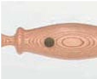
23、24は、赤い色を付けた木を張り合わせて鯉の形にしているので、うろこが浮き出している。目の部分は白目にカバ材を、瞳にはナラウモレ木を象眼している。