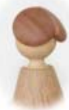
見えないところまで、丁寧に細工を施した。