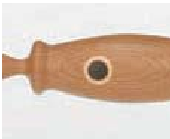
21、22、25は、鯉の白目にエリマキを、黒目にナラウモレ木を使い雰囲気を出した。

「鯉のぼり」「雛人形」 子どもにちなんだ節句もクラフトで楽しみたいと考えた。節句の時期だけでなく、いつでも飾っていただけるような、可愛い作品が出来上がった。